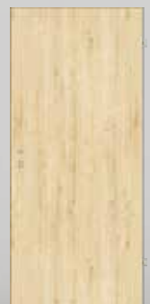
Modell P1 Querlaufende Struktur