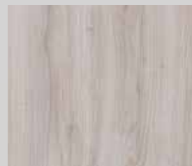
BASICLINE Akazie Mystik