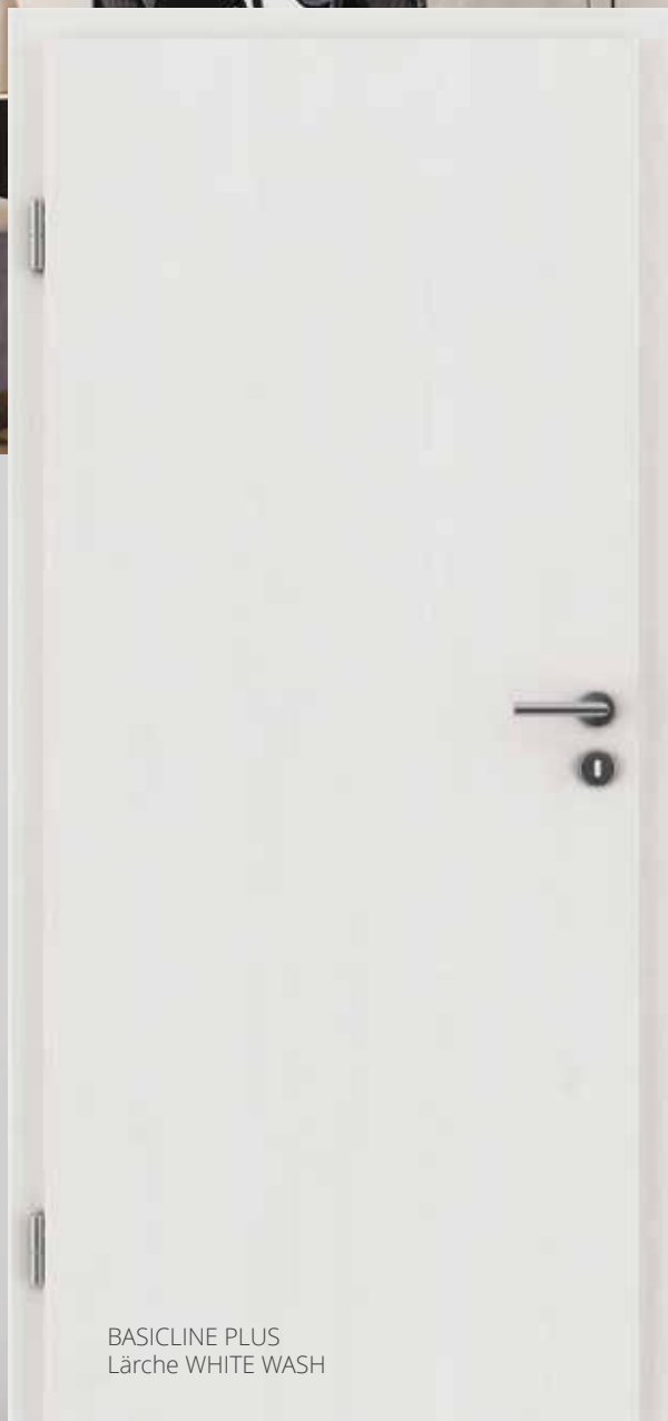
BASICLINE PLUS Lärche WHITE WASH